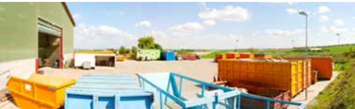
Wertstoff- und Recyclingpark in Stronsdorf

MO-FR: 8-12:00 Uhr u. 13-16:00 Uhr geöffnet.